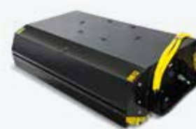
Lopata s kartáčem