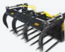
Vidle s přidržovačem