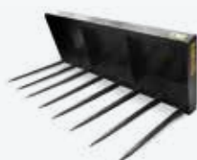
Vidle na hňůj