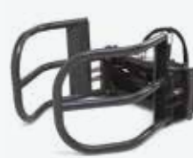
Kleště na balíky