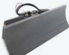
Radlice na sníh