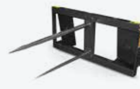
Bodce na balíky